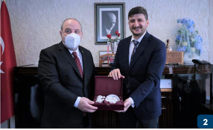
Sanayi ve Teknoloji Bakanı Mustafa Varank, Üniversitemiz Of Teknoloji Fakültesi'ni Ziyaret Etti