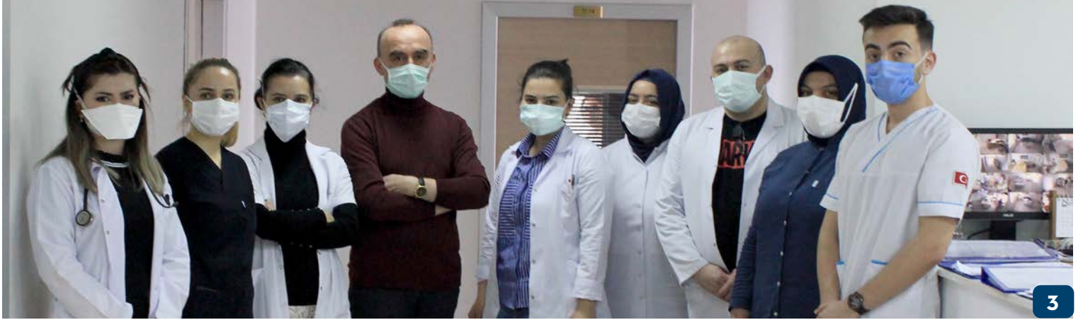
Azerbaycanlı Hastamıza Otolog Kök Hücre Nakli Başarıyla Yapıldı

Otolog Kök Hücre Nakli, hastanın sağlıklı kök hücrelerinin kemoterapi öncesi alındıktan sonra saklanarak kemoterapi sonrası hasta olan kemik iliğinin ortadan kaldırılması akabinde yeniden hastaya verilmesi olarak tanımlanabilmektedir.