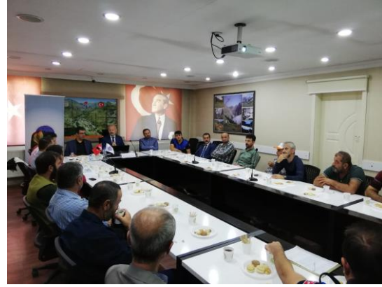
Etik Davranış İlkeleri ve Esasları Eğitimi