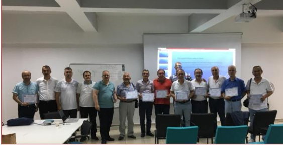
BOBİ'ler İçin Finansal Raporlama Standartları Eğitimi