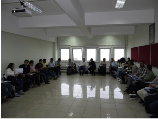
Akademik Düzeyde Proje Hazırlama Eğitimi